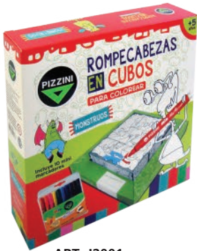
ART. J2001 ■ 8 Caja Box