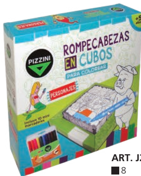
ART. J2002 ■ 8 Caja Box